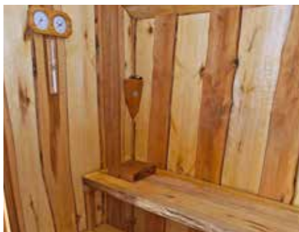
• Väggens lockbrädor är av hägg. Långsidorna som man lutar sig mot är liksom lavarna av asp eftersom hägg kan bli för varmt.