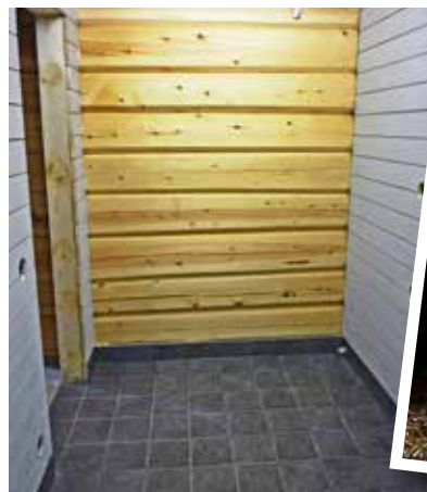
• Under 2013 färdigställdes tvåtuttugan i det nya huset för att få igång värmesystemet. Det blev fint kakel och träväggar med råplan som hylats med stål som ger grövre yta.

Läs mer om Khubilai på gårdens webbplats: http://cstjordskog.se