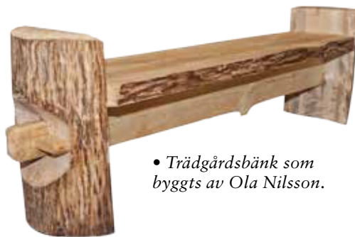
• Trädgårdsbänk som byggts av Ola Nilsson.

Ola att bygga. Solosågen har uppdaterats med en elsåg.