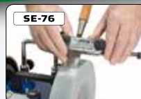
Jigg för raka eggars