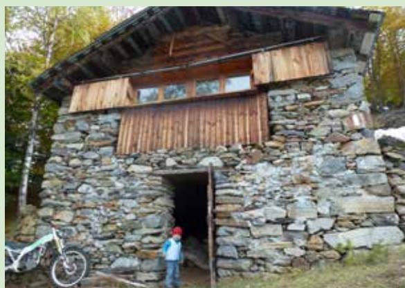
• Bergsstugan i norra Italien renoverades med solosågad lärk.