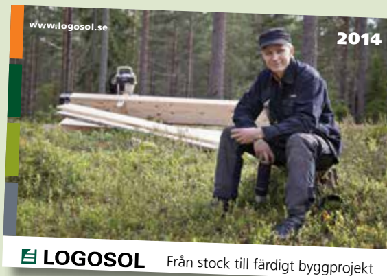
LOGOSOL Från stock till färdigt byggprojekt

Den nya produktkatalogen är fullmatad med bilder, tekniska data och steg-för-steg illustrationer. Produktionen har involverat alla avdelningar på huvudkontoret, samt leverantörer och återförsäljare. Resultatet är en nyskapande presentation av Logosols sortiment, där inspiration, byggprojekt och resultatbilder blir en naturlig del av maskinernas produktbeskrivning. Du kan beställa den nya katalogen redan nu. Gör en förbeställning på www.logosol.se så skickar vi den direkt till dig när den kommer från tryckeriet.