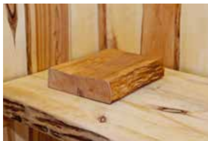
• Bitar av al fungerar som fina kuddar på lavarna.