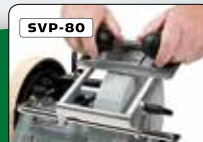
Jigg för profilstål