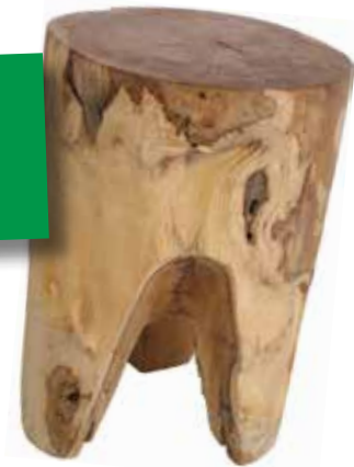
Pall i återvunnen teak, storlek varierar, Rum21