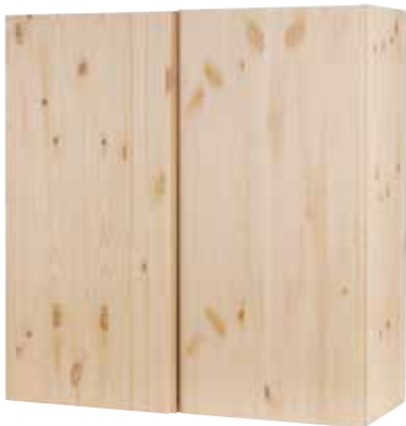
Skåp Ivar, obehandlat trä, 85 x 80 cm, Ikea

Obehandlat och naturnära är en tydlig trend inom inredning. För oss som gillar trä är det spännande se nya former och lösningar där ytan gärna får visa träets ådring. Det naturliga materialet ger en varm känsla och passar alla stilar. Vi hoppas att du får inspiration att skapa och bygga själv!