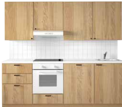
Köksluckor i massiv ek. Härlig känsla av råsågat. Metod/Hyttan, Ikea.