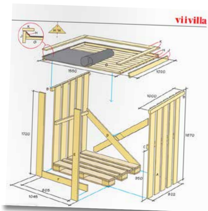
Ur Vi i Villa nr 8, 2013. Illustration: Anna och Anders Jeppson.

Takpapp: 1,6 kvadratmeter Takpappsklister Pappspik Skruv av olika längder