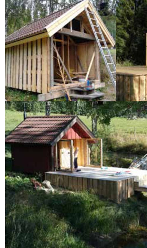
• I somras stod hela bygget färdigt med alla läste om Nysagats byggartävling, men bidra dina fina bilderna inspirerade dock redaktionen att läsa om i den här artikeln!