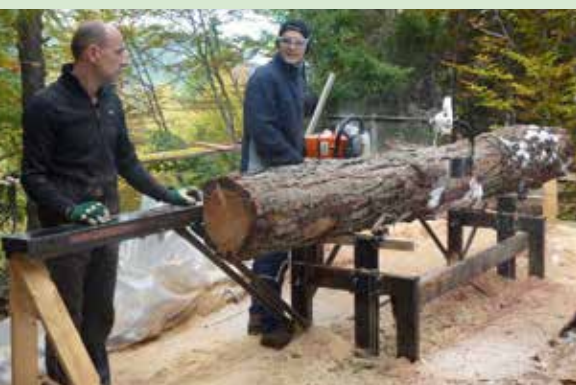
• Solosågen flögs upp med helikopter och kompletterades med en kran för att lättare få de tunga stockarna på plats.

Stihl-sortimentet finns även i Logosols egen butik på huvudkontoret, där du även kan få visningar av sågverk och snickerimaskiner. Välkommen in om du har vägarna förbi Härnösand!