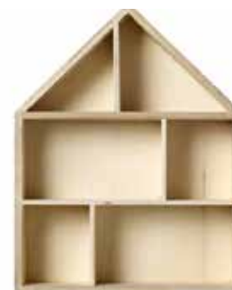
Hus-hylla i trä, höjd 25 cm, Bloomingville