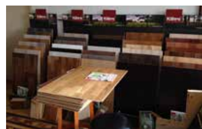
• Golvföretaget har en visningslokal i Loomis, norra Kalifornien. I sortimentet finns bland annat Kährs.

När maskinparken skulle uppdateras valde man den större fyrkuttermo-