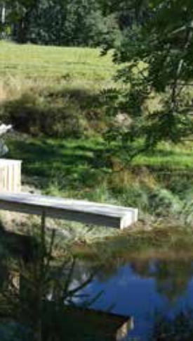
n och brygga. Familjen get kom in för sent. De till besöket som ni kan