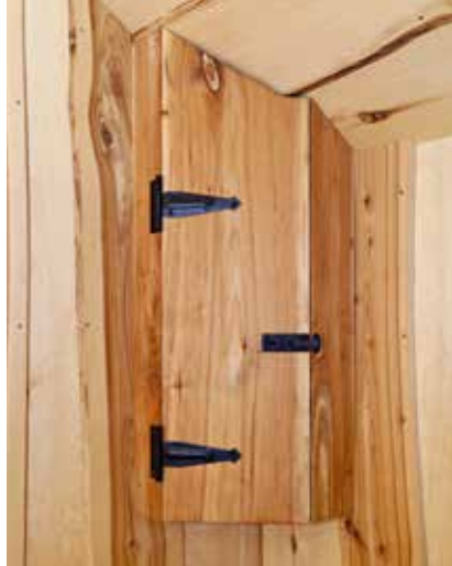
• Skåp av sälg med vackra smides- detaljer.