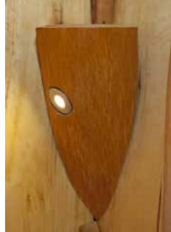
• Vägglampa av al med infälld led lampa ger ett stämningsfullt ljus.