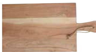
Skärbräda av Akacieträd, House Doctor.