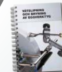
Utförlig handbok i våtslipning