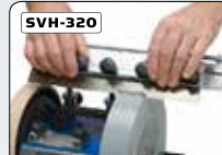
Jigg för maskinhyvelstål

Dessa jigger och tillbehör medföljer maskinen!