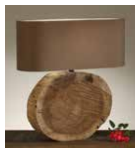
Lampfot i trä med skärm, 20x57 cm, U.N Interiör