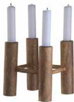
Ljusstake i trä, 14 x 14 cm, Madam Stoltz