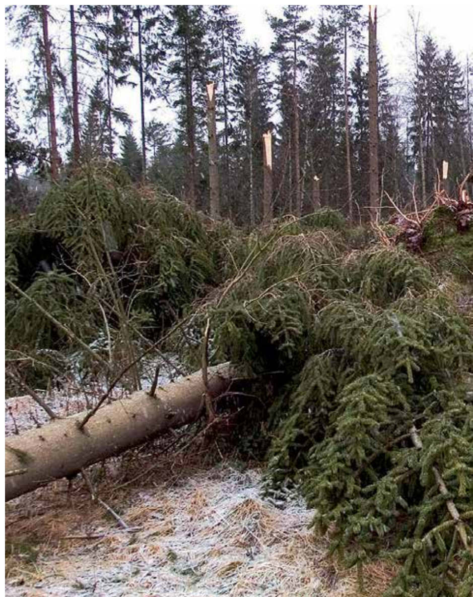
Att skadorna efter Gudrun och Per blev så omfattande berodde delvis på milda vintrar. Utan tjäle i marken var granarna med sina yliga rötter ett lätt rov för vindarna. Enligt FN:s klimatgrupp har vi mildare vintrar att vänta oss, vilket gör skogarna mer sårbara för vinterstormar.

Det finns goda skäl för långsiktiga skogsägare att förbereda sig för framtida skador. Till förberedelserna hör ett eget sågverk. Det är även till stor nytta mellan stormarna för att upparbeta enstaka vindfällen och plocka ut träd som angripits av barkborrar. Därmed får barkborren sämre förutsättningar. Arbetet ökar skogens värde för kommande generationer och skapar samtidigt stora värden i form av sågat virke för avsalu eller användning på den egna gården mellan avverkningarna.