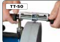
Svarv-verktyg för stenen