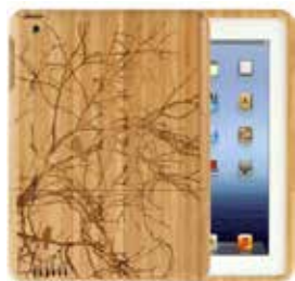
iPodskal i snidad bambu, fyndiq. se.