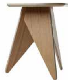
Pall i ekfanér , höjd 45 cm, diameter 39 cm, Boconcept.