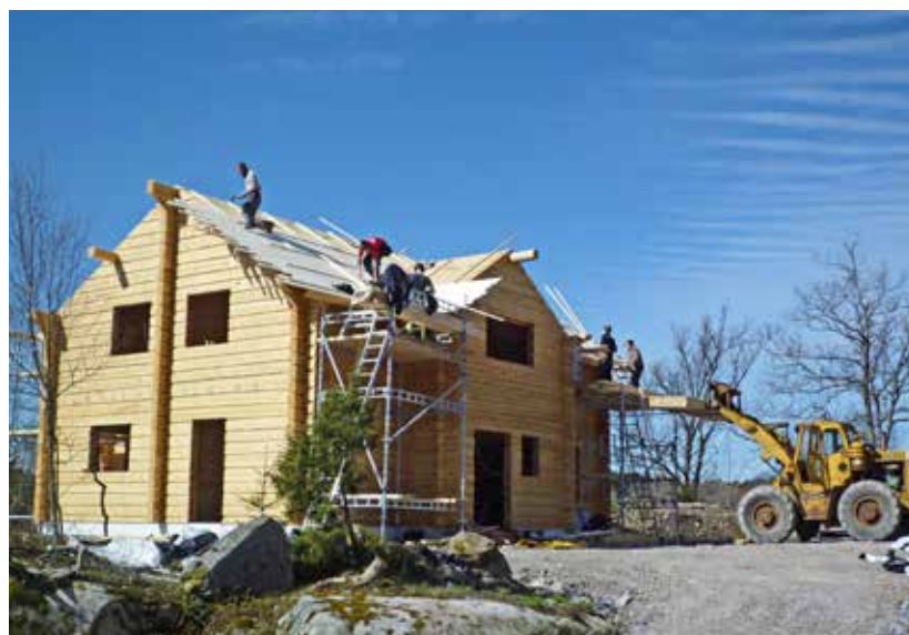
• Under våren 2012 restes timmerstommen och huset kom under tak med egentillverkad råspont.